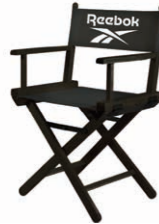
LOGO CHAIR RBCHAIR Dimensions: 49 cm x 72 cm x 34 cm