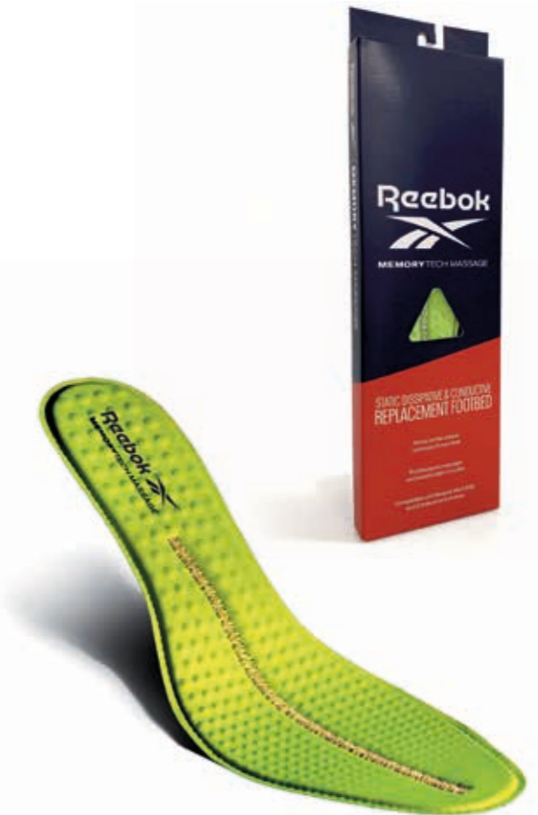
FOOTBED RBMT Removable Cushion Footbed for ESD and Conductive Footwear Fluorescent Green