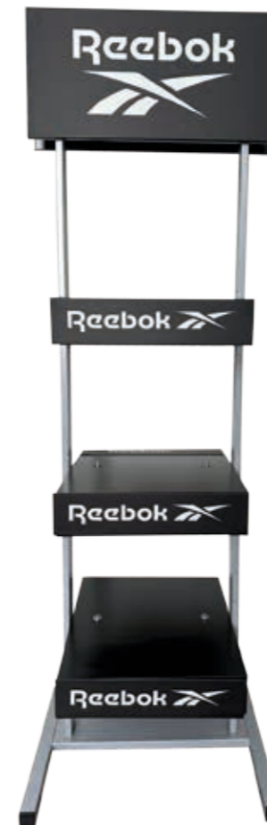
LOGO STAND RBSTAND Ecofriendly Display Dimensions: 50 cm x 160 cm x 50 cm