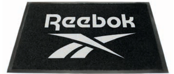
LOGO MAT RBMAT Dimensions: 60 cm x 90 cm